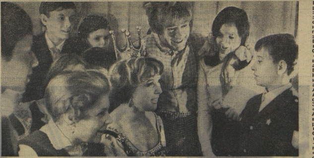
Праздник «Театр и дети» превратил В. К. Васильеву в Фею, С. В. Мишулина — в Нарльсона, а О. А. Аросова стала веселой и доброй вилетршей тетей Илавой.

Большая, круглая, подвешенная разноцветными огоньками эмблема Недели «Театр и дети» заиграла в фоне Театра сатиры. «Взрослого» спектакля не будет! Начинается детский праздник! Фея Театра заслуженная артистка РСФСР Вера Васильева взмывает волшебной палочкой: «Бэй Дэй!» Сейчас кто-то должен появиться! — Не тани, Фея! — раздаётся всем знакомый голос народного артиста СССР Анатолия Панахова. — Я уже здесь! На сцене оказались самые известные, самые любимые артисты — Татьяна Пельтцер, Андрей Миронов, Ольга Аросова, Спартан Мишулин — он же Нарльсон — и Наталья Защинина — Первоклассница «прозрались» в зал без билета... Артисты участвовали в смешной интермедии, рассказали весёлые песни, показывали сцены из спектаклей. Сцены из своих постановок показали многие москвичские театры. — Все театры России принимают участие в Неделе «Театр и дети», — сказал, открывая праздник, министр культуры РСФСР Ю. С. Мелентьев. — Пусть крепче станет дружба детей и театр!